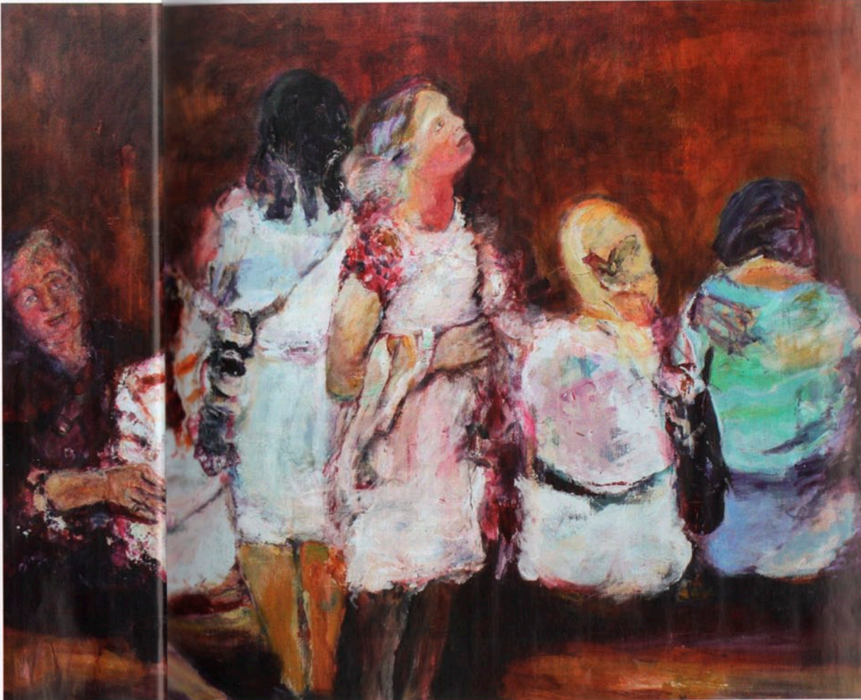
Rome, 180x120, Acryl op linnen