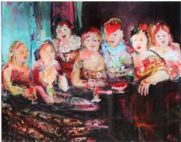
Suikerfeest, 50x40, Acryl op linnen